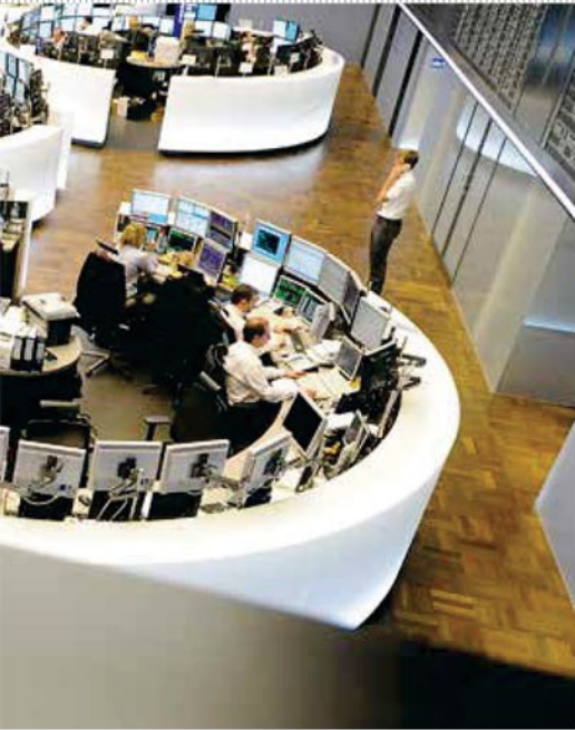
Parkett in Frankfurt: Der neue Börsenchef Theodor Weimer will eine Aktien-Erlebniswelt aufbauen. Dann wird auch das Segment Scale sichtbarer

ten wäre Leupold ein Anreizsystem für Aktieninvestments, wie es jüngst Italien eingeführt hat. Dort gibt es steuerfreie Sparprodukte, deren Einlagen in kleine und mittlere Firmen investiert werden.